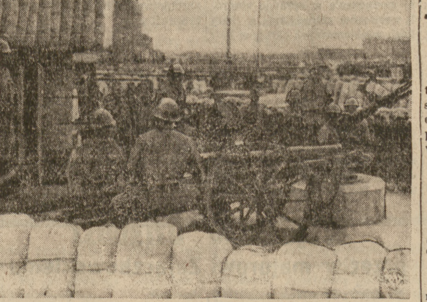
ODDZIAŁY JAPANEJSKIE W OCZEKIWANIU CHINSKEIGO NATARCIA