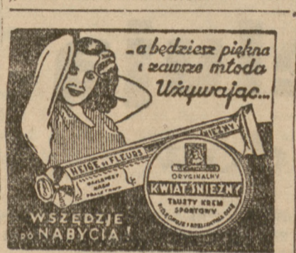
„a będziesz piękna i czurowa młoda używając...”

3) Hiszpanie, których pan broni, byli zacieklemi germanofilami w niezbyt dawnej epoce. Mam na myśli lata 1914 — 1918. Dzięki tym właśnie germanofilom, Hiszpania nie mogła stanąć przy boku Francji. Są to ci sami germanofile — czego dowodem jest hołd, złożony przez zbuntowanego generała Cabanellos, Adolfa Hitlera, „Nie tylko podziwiamy Adolfa Hitlera, my go także czcimy” — „Deutsches Nachrichtenbüro” 15.X 36).