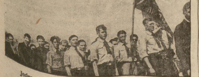
Jedna z grup przepięknej niedzielnej manifestacji. Z niezapomnianych chwil niedzielnego Złotu.

Na froncie Leon kolumny powstańców przerwały rządowe linie obronne na odcinku Lillo i posunęły się o 8 km, naprzód, zajmując szereg pozycji na południe od Sierra Morquera.