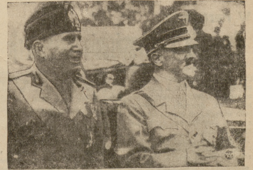
Wtorek miał w Niemczech charakter święta państwowego. Wszelka praca ustała. Kulminacyjnym punktem dnia była manifestacja wieczorna na Haifeld, na cześć Mussoliniego.