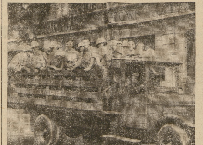
Oddział żołnierzy amerykańskich, przybyły dla ochrony interesów amerykańskich.

Wydział Wykonawczy Związku Dziennikarzy R. P. na posiedzeniu odbytym dnia 29 b. m. jednomyślnie potępił akty terroru w stosunkach prasowych. Wydział Wykonawczy, który w ostatnich czasach wspólnie z Polskim Związkiem Wydawców Dzienników i Czasopism podjął inicjatywę przestrzegania zasad etyki pomiędzy pismami, stwierdza z zadowoleniem, że w konkretnym wypadku cała prasa bez różnicy kierunków politycznych je dnożył potępiła metody gwałtu fizycznego. (PAT).