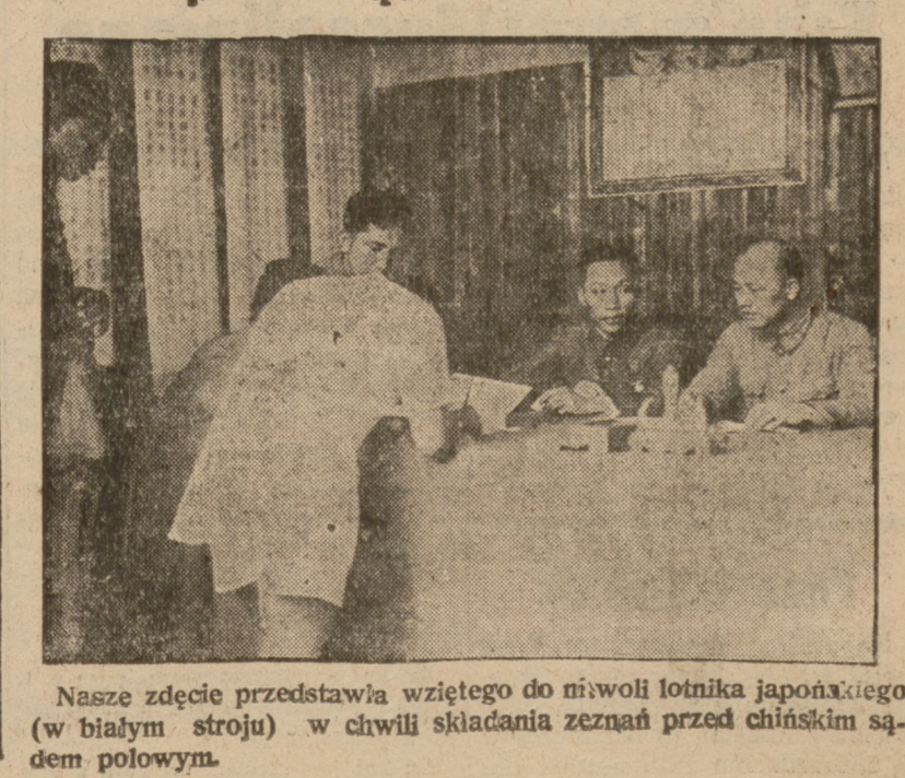
Nasze zdjęcie przedstawia wziętego do niewoli lotnika japońskiego (w białym stroju) w chwili składania zeznań przed chińskim sądem polowym.