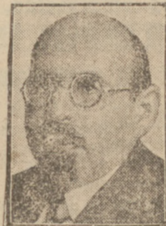
KRESTINSKI BOHATER PROCESU MOSKIEWSKIEGO.

zablokowane w Santo Susanna. Inny pociąg, wiozący 250 pasażerów, unieruchomiony został w Indio. Wylewy rozszerzają się w kierunku północnym i północno-zachodnim od Los Angeles.