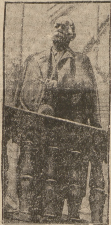
MAKSYM GORKIJ, KTÓRY ZOSTAŁ PODOBNO OTRUTY.

Zeznania Rykowa w procesie moskiewskim wyjaśniają wreszcie co stało się z .zw. frakcją Tomskiego, t. j. z frakcją komunistów, oponujących przeciwko polityce robotniczej Rządu sowieckiego w okresie piatiletek. Rykow oświadczył, że „główną częścią składową kontrrewolucyjnej organizacji w Moskwie był przewodniczący Centralnego Komitetu związków zawodowych, Tomskij (popelniał samobójstwo w r. 1935) z funkcjonariuszami tych związków”. Tomskij walczył z bezwzględnym podporządkowaniem związków zawodowych t.zw. „produkcyjnym celom piatile-