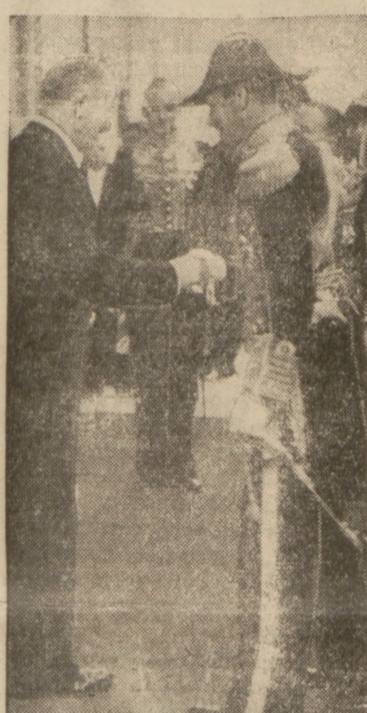
KRÓL JERZY VI I PREZYDENT LEBRUN.

Po przybyciu do Villers - Bretonneaux król udał się na cmentarz, który stanowi terytorium angielskie. W kwadrans po królu przybył na cmentarz Prezydent Republiki Lebrun, którego król Jerzy powitał niejako „na swoim terytorium“.