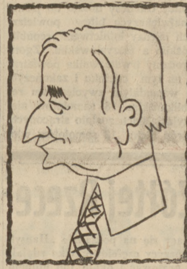
SEKRETARZ STANU SPR. ZAGR. AMERYKI HULL.

Dobrobyt Stanów Zjednoczonych byłby zagrożony, gdyby w innych krajach panował głód i rozkład. Stany Zjednoczone powitalyby pokojową współpracę z innymi narodami dla przywrócenia pokoju, bezpieczeństwa i dobrobytu na świecie. (PAT.).