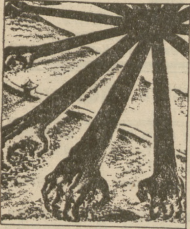
JAPOŃCZYCI SIĘGAJA PO HANKOU

Japońska rada ministrów postanowiła kontynuować a nawet wzmocnić wysiłki wojskowe, dyplomatyczne i gospodarcze, mające na celu definitywne obalenie Rządu marsz. Czang-Kai-Szeka oraz utworzenie nowego oczywiście projapońskiego Rządu w Chinach. Zajęcie Hankou uznano za najpilniejszy cel. Wedle opinii kół politycznych Rząd japoński, po incydencie w Czang-Ku-Feng, dąży do rozstrzygnięcia walk w Chinach w sposób bar-