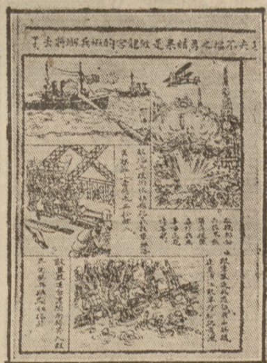
CHIŃSKI PLAKAT WOJENNY.

bieg bardziej zadawałajacy dla Chińczyków. Przechodzą oni do stałych natarć w kierunku Susung, również Huanmei otoczono już z