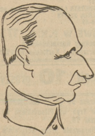
GEN. GAMELIN WÓDZ NACZELNEJ ARMII FRANCUSKIEJ

Częściowe powołanie rezerwistów we Francji w odpowiedzi na wzmocnienie sił zbrojnych po stronie niemieckiej