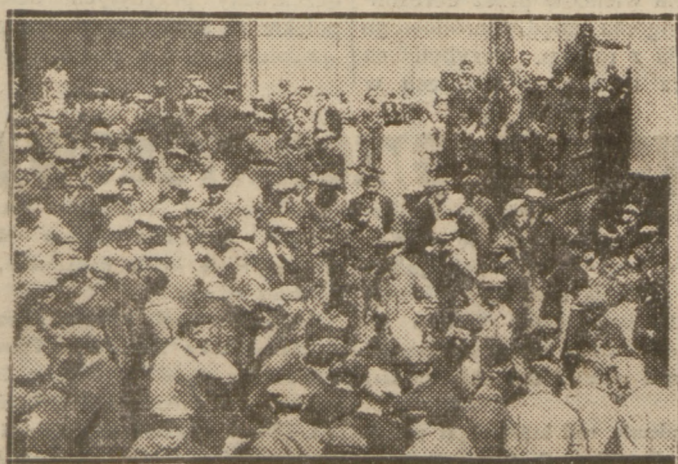
MASÓWKI W FABRYKACH PARYSKICH.

Mimo militaryzacji kolei, kolejarze wezmą udział w strajku powszechnym