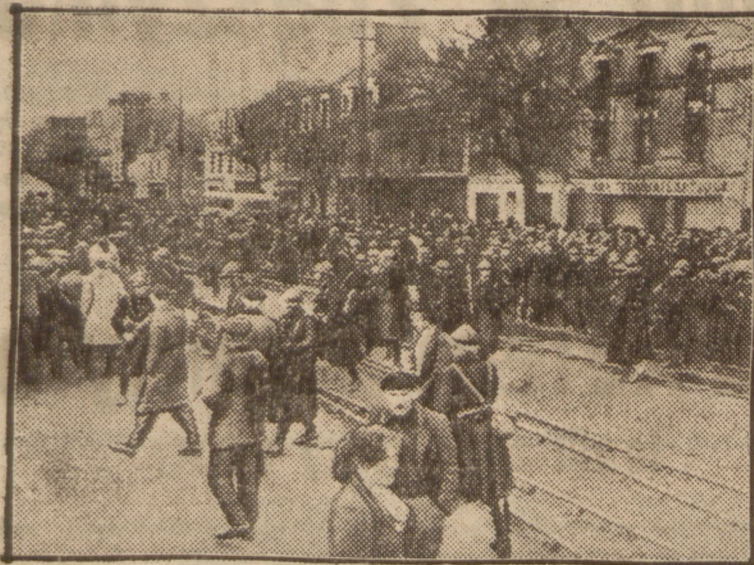
W porcie francuskim St. Nazaire doszło do zajść pomiędzy strajkującymi robotnikami a lamistrajkami. Na zdjęciu scena z interwencji policji i gwardii lotnej.