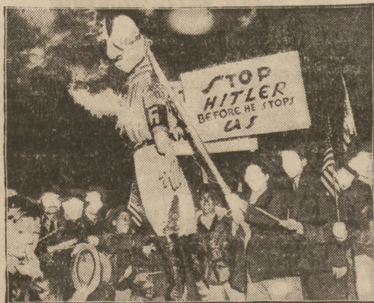
W Filadelfii odbyły się wielkie demonstracje antyhitlerowskie. Kulminacyjnym punktem demonstracji było spalenie kukły w mundurze hitlerowskiego szturmowca.