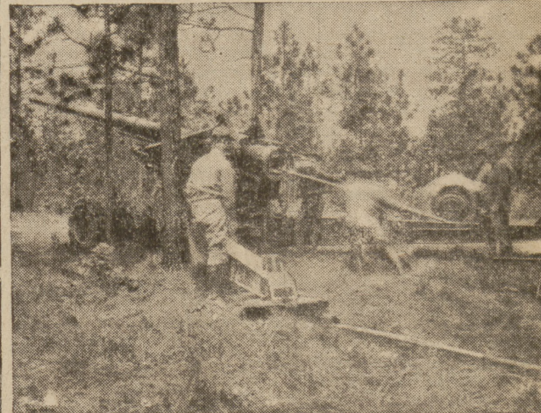
Fragment ćwiczeń amerykańskiej artylerii przeciwlotniczej.