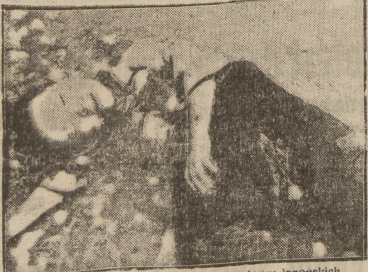
Chłopiec chiński padł ofiarą lotni ków japońskich.

Na czwartej stronie: Rewelacyjne wiadomości o agenturach rosyjskich w Niemczech