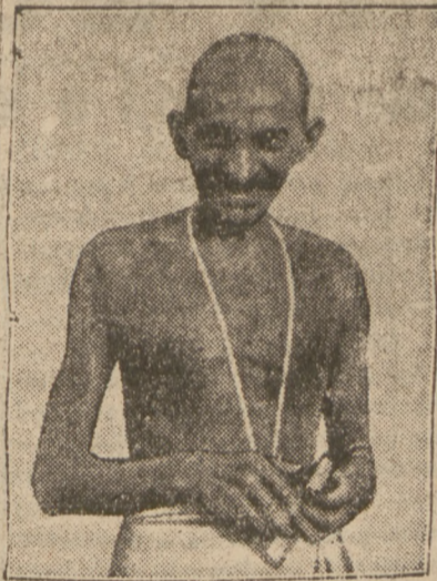
którego zwycięski strajk głodowy w obronie demokracji wywołał ogromne wrażenie na całym świecie.