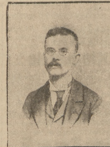
Wspomnienie o zasłużonym Towarzyszu — w 25 rocznicę Jego zgonu — zamieszczamy na str. 3-ej.