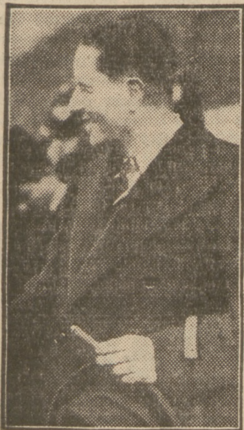
ANGIELSKI MINISTER HANDLU ZAMORSKIEGO BAWIĄCY OBECNIE W WARSZAWIE.

Równocześnie, według wiadomości z Los Angeles, tamtejszy konsul czeskosłowacki oświadczył, że były prezydent Benes wraz ze wszystkimi przedstawicielami Czechosłowacji w Stanach Zjednoczonych przystępuje natychmiast do wypowiedzenia walki o wolność i niepodległość Czechosłowacji. Konsul czeskosłowacki w Los Angeles zapowiedział, że b. prezydent Benes przystąpi do utworzenia na terytorium Stanów Zjednoczonych, prawdopodobnie z główną kwaterą w b. poselstwie czeskosłowackim w Waszyngtonie, nowego narodowego rządu tymczasowego Czechosłowacji, złożonego z przedstawicieli zarówno Czechów, jak i Słowaków.