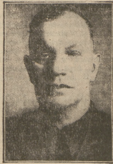
FASZYSTA CZESKI GAJDA PIERWSZY ZGŁOSIŁ SIĘ DO SŁUŻBY U HITLERA.

Jak się okazuje gen. Prchala na czele 16.000 żołnierzy czeskich przedostał się do Rumunii. Wojska czeskie zostały oczywiście rozbrojone i internowane.