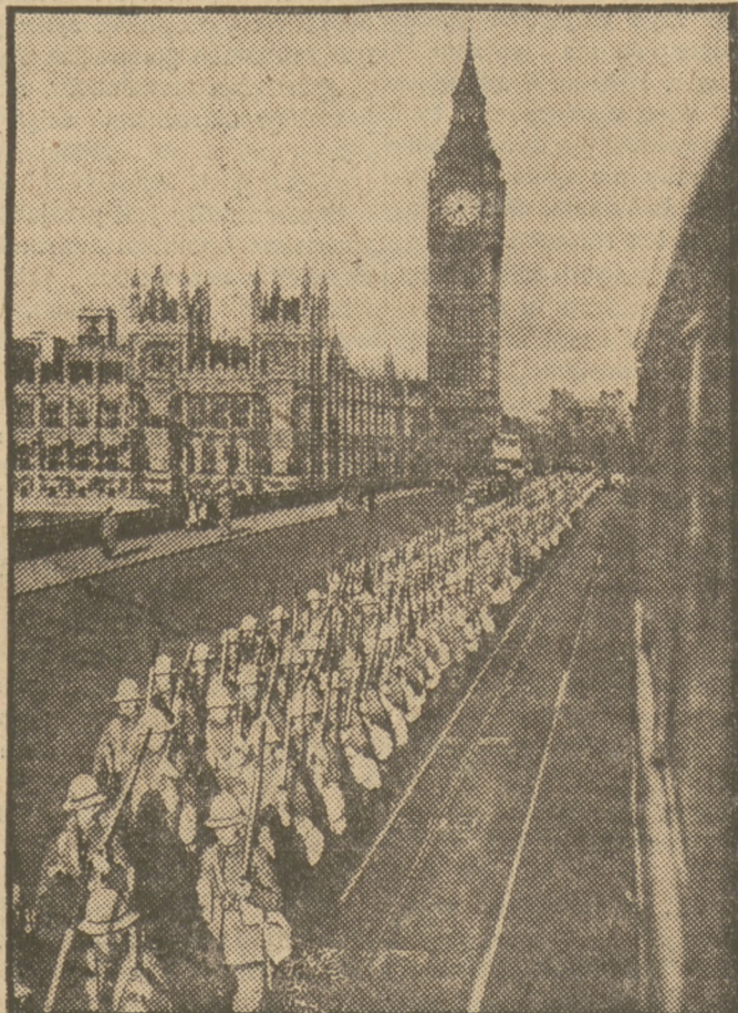
WOJSKA ANGIELSKIE WYRUSZAJĄ Z LONDYNU DLA WZMOCNIENIA ZAŁÓG GIBRALTARU