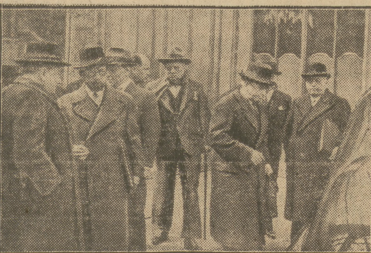
Członkowie Rządu opuszczają Pałac Elizejski po posiedzeniu Rady Ministrów.