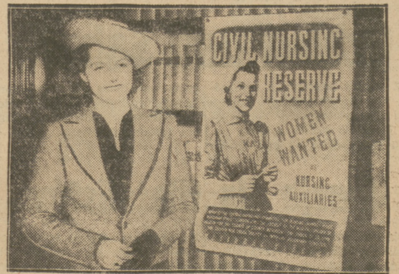
W Anglii rozpoczęto werbunek 100.000 kobiet do służby pomocniczej. Na zdjęciu plakat propagandowy służby pomocniczej. Przed plakatem stoi modelka, której zdjęcie figuruje na plakatach.