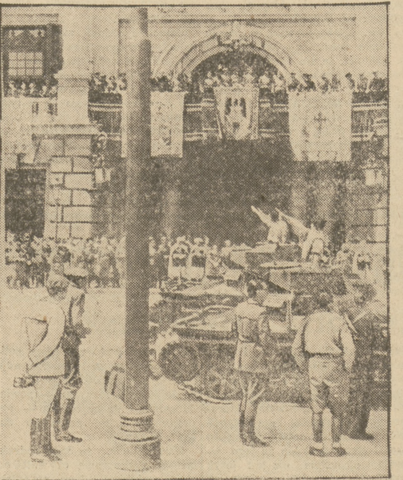
GEN. FRANCO NA BALKONIE PRZYJMUJE DEFILADĘ SWEJ „NARODOWEJ” NIEMIECKO - WŁOSKO-MAURYTAŃSKIEJ ARMII

mochołów z materiałem technicznym, ale najczęściej dział, mniejszych i większych, pomalowanych na brązowo, odznaczających się nieraz zupełnie fantastycznym rysunkiem linii. I wszędzie, przy wszystkich działach i na wszystkich wozach ru-