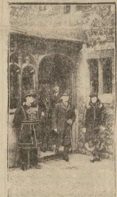
GEN. WEYGAND W LONDYNIE

stawienie ról angielskich na linii Maginota już obecnie, aby w chwili wybuchu wojny rozporządzać dostateczną siłą na froncie zachodnim.