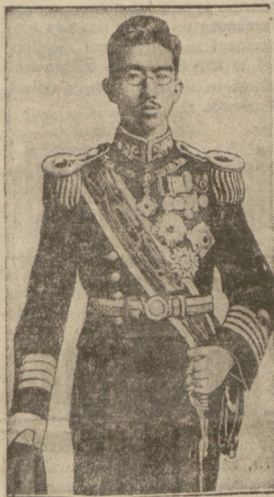
CESARZ JAPONSKI HIROHITO

Wojska japońskie okupowały już całe Swatau. Z odległości wielu mil od miasta widać LUNY POŻARÓW, WZNIECONYCH PRZEZ CHINCZYKÓW w chwili odwrotu. Pożar zniszczył już całe dzielnice. Ucierpiał również olbrzymie składy towar.