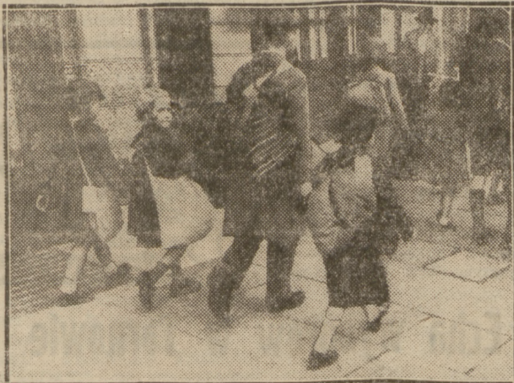
W Londynie, w dzielnicy Chelsea odbyły się ćwiczenia obrony lotniczej Londynu, połączone z próbą ewakuacji dzieci. Na naszym zdjęciu ewakuacja dzieci z zagrożonej dzielnicy.