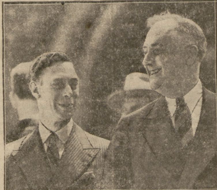
Król angielski Jerzy i Prezydent Roosevelt w Waszyngtonie.