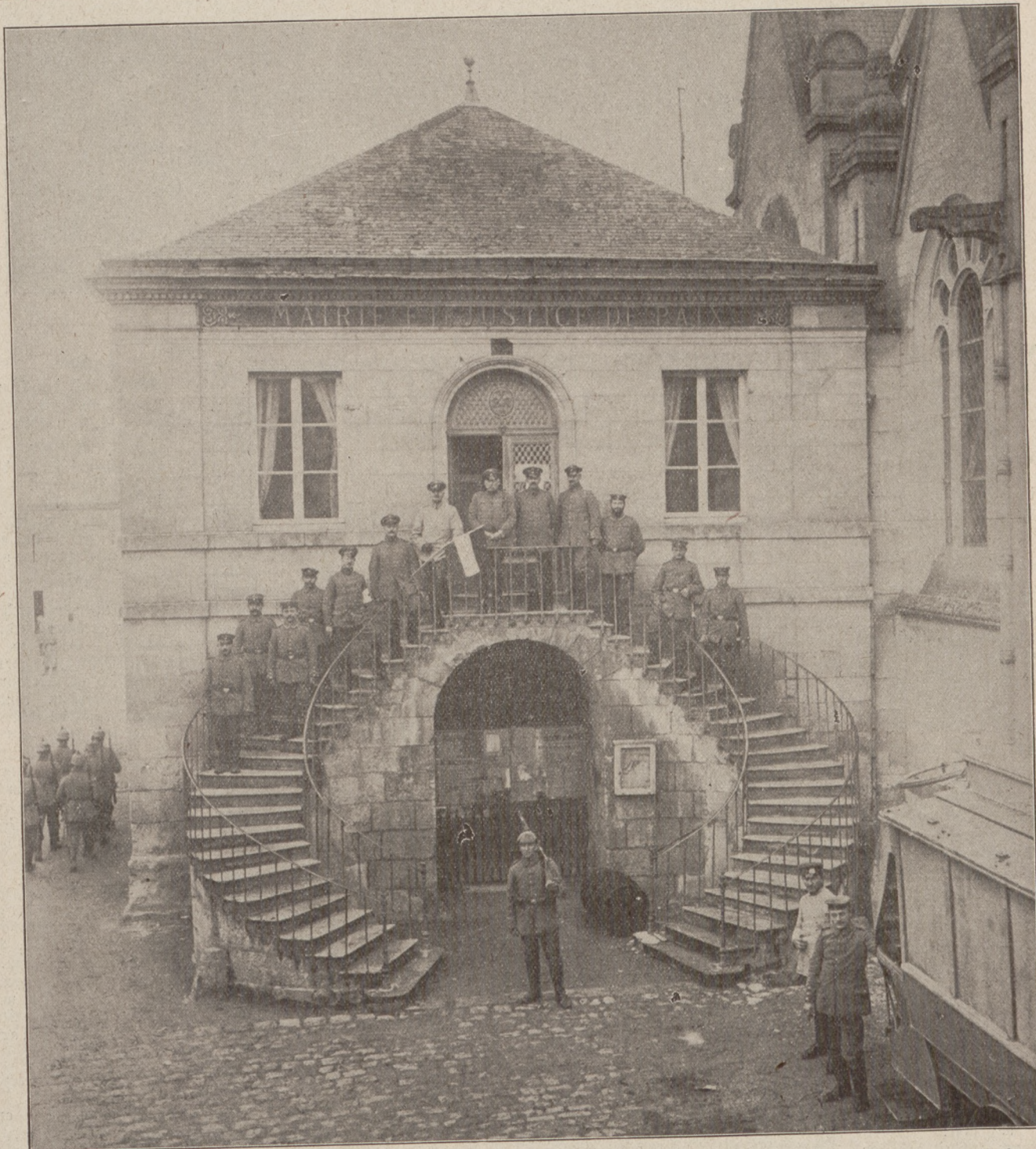
Das Generalkommando eines Korps vor dem Bürgermeisteramt einer kleinen Stadt vor Reims.