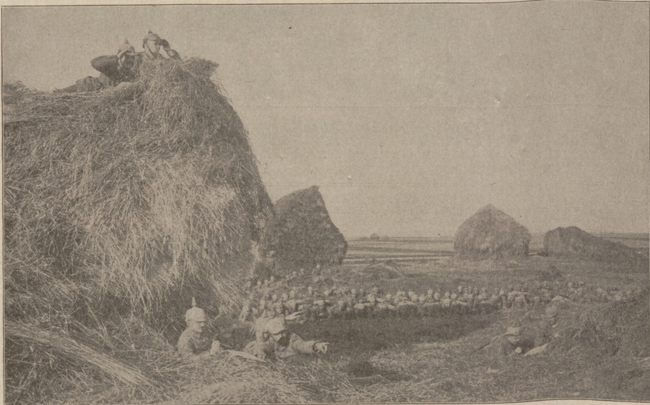
Infanterie in Deckung mit Ausguck vor dem Ausschwärmen vor Soissons.

Wir sind nicht auf dieser Welt, um glücklich zu sein und zu genießen, sondern um unsere Schuldigkeit zu tun, und je weniger meine Lage eine selbstgemachte ist, um so mehr erkenne ich, daß ich das Amt versehen soll, in das ich gesetzt bin.