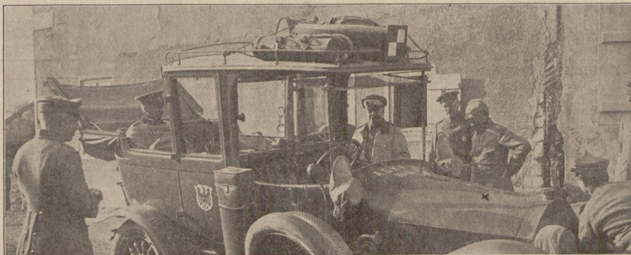
Generalleutnant v. Knobelsdorff, Chef des Stabes der 5. Armee in Ayremont.