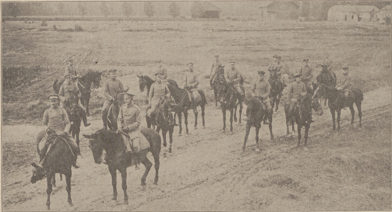
Offiziere auf einem Beobachtungsritt vor Reims.