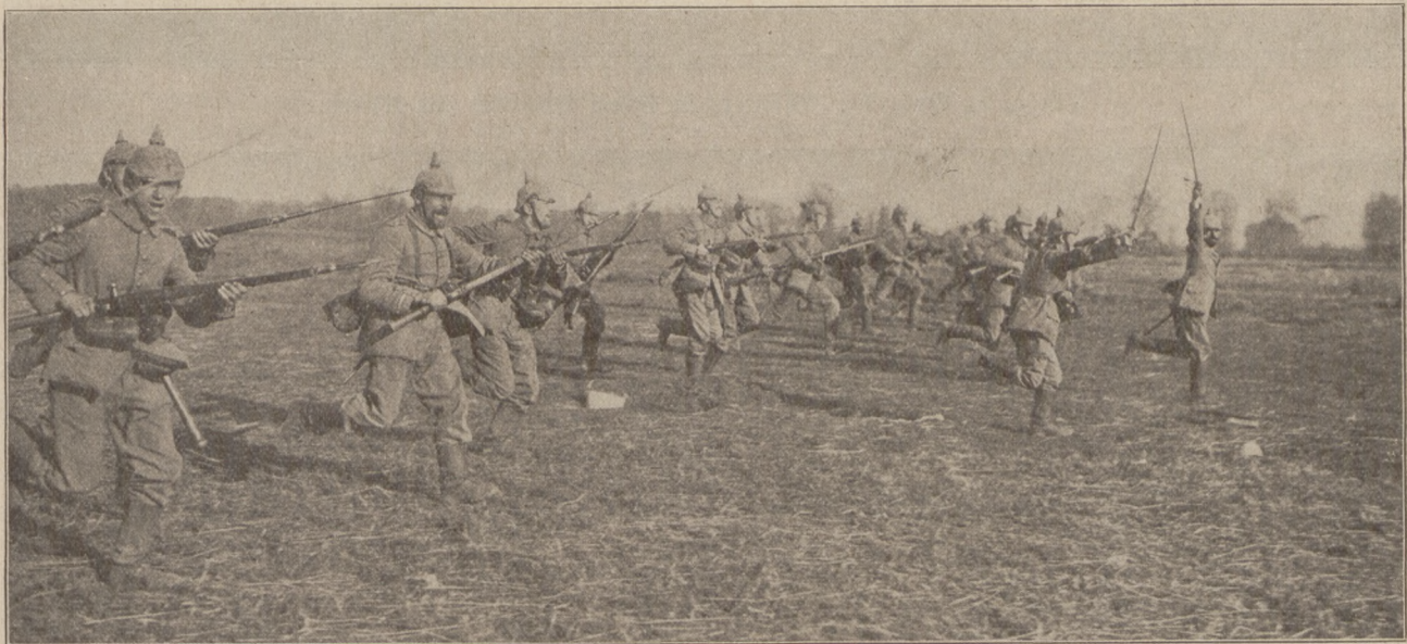
Sturmangriff vor Soissons.