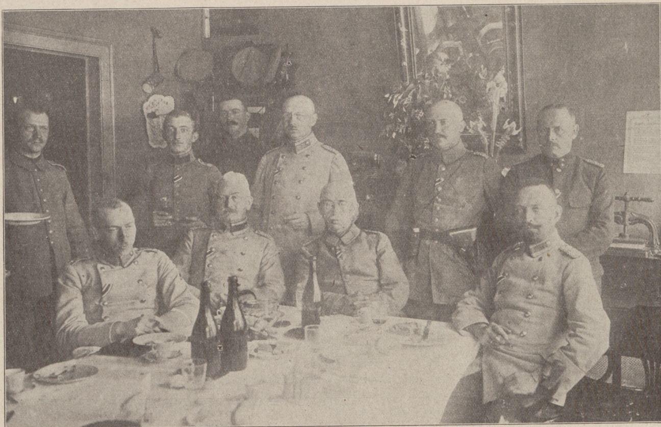
Ein gutes Quartier. Offiziere in ihrem Quartier vor Reims.