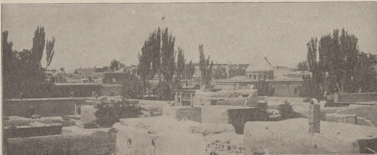
Teheran, die Hauptstadt Persiens,

das durch die Verkündung des heiligen Krieges der Muselmanen ebenfalls in den Weltkrieg hineingezogen wurde und in dessen nördlichster, an Rußland angrenzender und zum Teil von Rußland besetzter Provinz Aserbeidschan bereits Kämpfe stattgefunden haben.