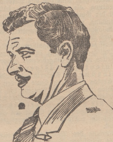
George Bancroft, der „König der Unterwelt“.

Sollte es mir einmal einfallen, meine Memoiren zu schreiben, so darf folgende kleine Geschichte nicht fehlen. Vielleicht finden Sie sie erheiternd aber ich, als leidtragender