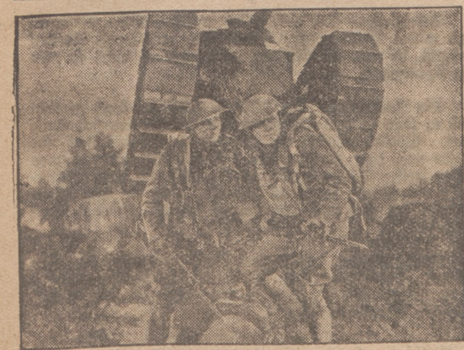
„Die Welt in Flammen.“ Ein großer amerikanischer Kriegsfilm, der in unerhörter Gestaltung das Kriegserlebnis eines jungen Burschen zeigt. — In der Hauptrolle Richard Barthelmess.

Auf dem Zettel stand folgendes: Der berühmte Darsteller Hans Albers, bekannt aus den Stücken von „Don Carlos“ bis „Barteltts Nr. 10“, gibt sich die Ehre, das geehrte Publikum zu einer Nachmittags-Vorstellung einzuladen.