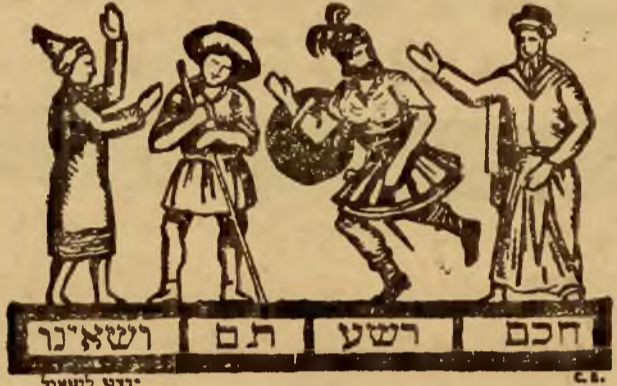
חכם רשע תם ושאינו יודע לשאת