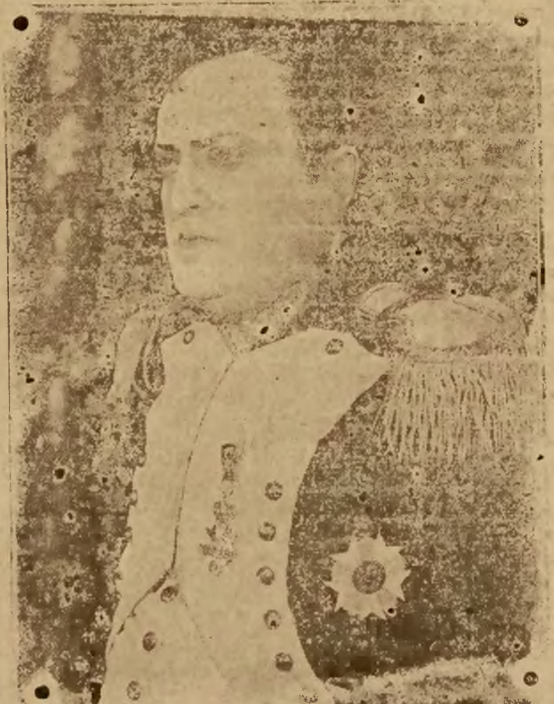
Od 10 Października 1927 roku NAPOLEON w MOSKAWIE