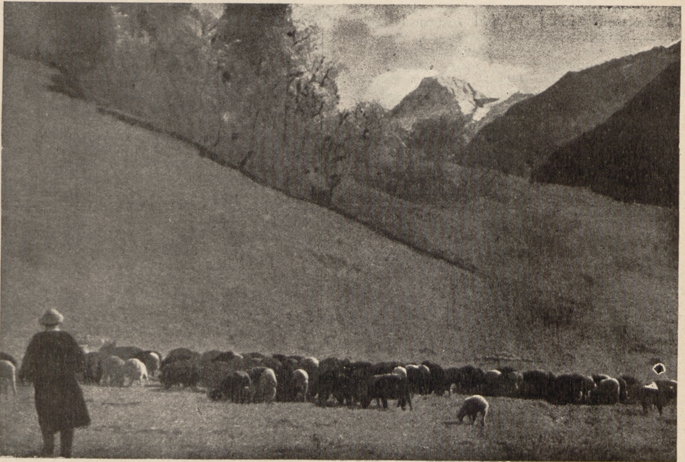
KARAÇAY'DA DAG OTLAKLARI