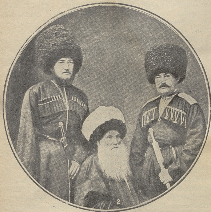
Имам Şam'il oğulları: Kazi Muhammet ve Muhammet Şefi (çar zabitanı kıyafesinde) ile birlikte.

В 1846 г. Шамиль сделал смелую попытку завладеть Кабардой и Осетией. С 5-ю тысячами пехоты, 4-мя тысячами конницы при 7-ми орудиях он переправился через Терек у Татартупа (между Элхотом и Ардоном) и двинулся к аулам Большой Кабарды. Кабарда и Осетия не восстали, хотя население встретило войска Имама весьма радушно.