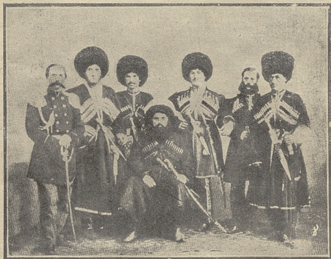
İmam Şamil ortata oturmuş, ayakdakiler soldan ikinci ve dördüncüler Kazi M. İmam ve ve Muhammet Şefi, üçüncü ve sonuncular: İmam Şamilin damadları Abdurrahman ve Abdurrahim, birinci ve beşinciler: miralay Boguslavski ve tercümeçi Gramov.

Наряду с администрацией, Имам упорядочил и податную систему. Казна имамата пополнялась закятном по шариату и податями с пастбищных мест и некоторых селений, которые в прежние времена платили таковую ханам. Кроме этого, в казну поступала также пятая часть военной добычи, также предусматриваемая нормами шариата. Все это в общей сложности составляло ничтожные суммы и никоим образом не могло быть сравнимо с доходами противной стороны. Хаджи-Али Чохский приводит следующие цифры годовых доходов имамата: для закята—523'102 меры хлеба в зерне*), 3200 голов овец и деньгами около 3200 рублей; для прямых налогов на пастбища и податей с некоторых аулов—около 4500 рублей. Поступления с военной добычи за 1850—52 г.г. представлялись следующим образом: в 1850 г. — 1000 рублей; в 1851 г. — 1013 рублей; в 1852 г.—15230 рублей (в этом году удалось захватить около Гянджи русский денежный транспорт). Доходы бейтулмала (государственного казначейства) имамата представлялись, согласно определению Гралевского, не более блестяще, чем доходы средней руки польского помещика. И с такими ничтожными средствами Имам сумел бороться в течении 25 лет.