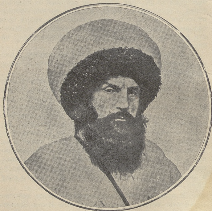
İmam Şamil—Имам Шамиль

войска прочно держали в своих руках дорогу Ставрополь — Георгиевск — Екатериноградская — Владикавказ — Тифлис, отделяя клином укреплений восточную часть Северного Кавказа от западной. Большинство феодальных правителей Дагестана признало русскую власть. Русское золото сделало значительные опустошения и в центральном и западном Кавказе. Все