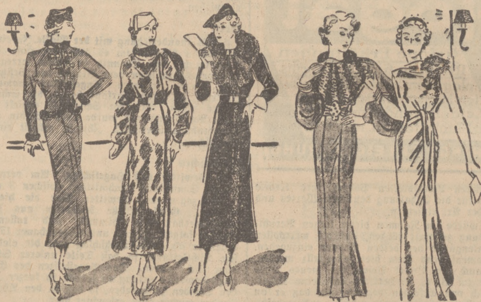
Merke! hübsche Modelle für die winterlichen Moden

Ergänzend sei noch bemerkt, daß kalt aufzusetzende Kräuter mit kaltem Wasser übergossen, 6 bis 7 Stunden ziehen müssen, dann erst gekocht werden sollen. Zu brühende Kräuter mit spritzend kochendem Wasser übergossen und nach zehn Minuten abgeseiht werden müssen. Im allgemeinen rechnet man einen Teelöffel bis einen Eßlöffel voll Tee auf eine Tasse Wasser und süßt mit Kandis, Fenchelhonig oder Lakritz nach Geschmack. Diese Heilkräuter sind abends vor dem Schlafengehen oder noch besser morgens nüchtern zu trinken, wobei zu berücksichtigen ist, daß zwischen Trinken und Einnehmen des Frühstückes eine Frist von rund einer halben Stunde liegen sollte.