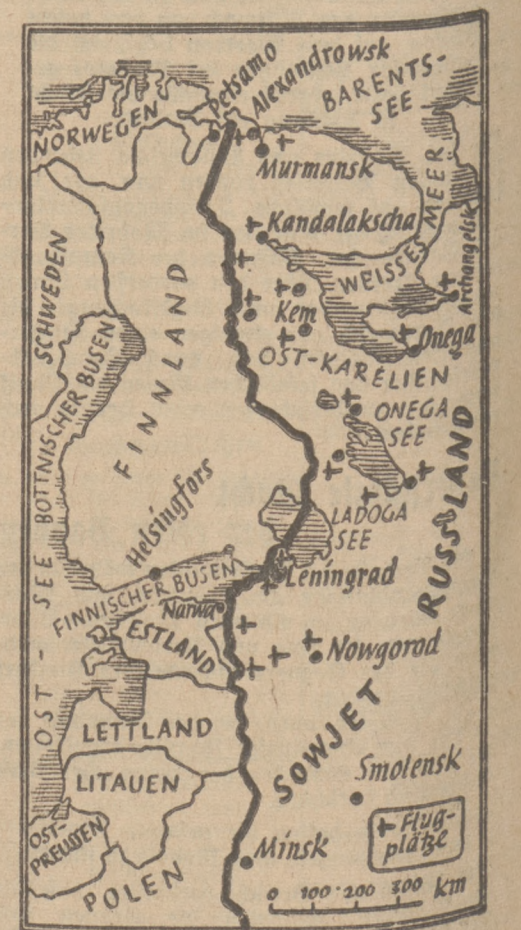
Rußland droht im Osten

bedeute. Die Armee wolle schrittweise ohne Gewaltanwendung die Staatsreform durchführen. Die Armee verurteile alle Gewalttätigkeiten. Die Erneuerung des Volkes müsse geistig vorbereitet werden.