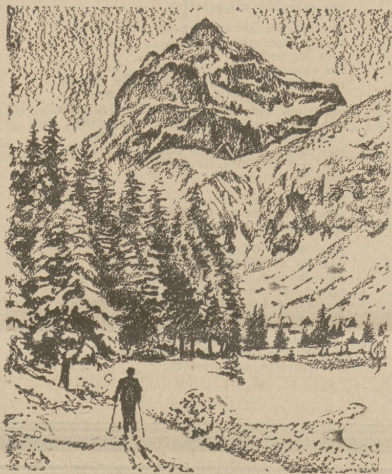
Auf einsamen Alpenpfaden. Verschneiter Alm oben am Riffelkogel.

Aber halt, eine Zwischenfrage: Wissen Sie, wie der derzeit regierende spanische König eigentlich heißt? Alfons! — Schön, das war nicht schwer zu erraten, da Spanien bereits eine Unzahl Alfons als König hatte. Aber: der wirkliche Alfons bemüht sich jetzt, seine Macht zu stabilisieren und Ordnung in die verfahrenen Verhältnisse seines Landes zu bringen? Da dies wahrscheinlich nur die Diplomaten beantworten können, sei seine „Nummer“ verraten: der derzeitige spanische König heißt Alfons XIII., geboren am 17. Mai 1886 in Madrid, verheiratet