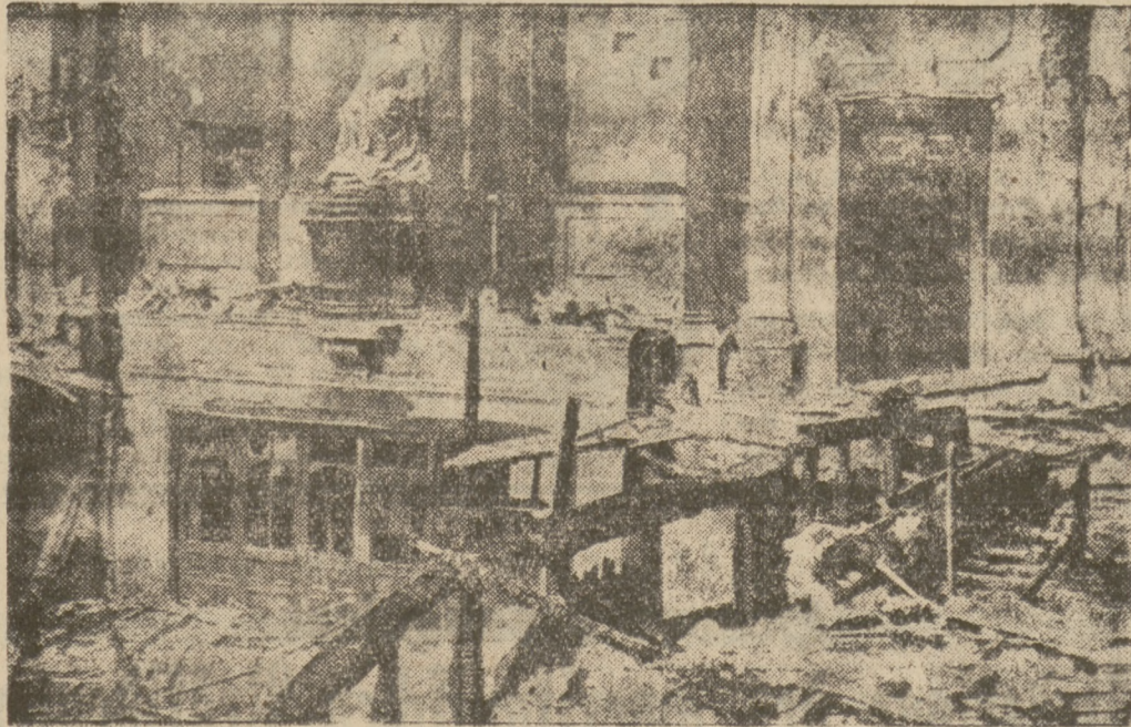
Londons Volkspalast durch Feuersbrand zerstört Das Innere eines eingestürzten Saales

Bukarest, 27. Februar. (R.) Im Schwarzen Meer herrschen seit einigen Tagen katastrophale Stürme, denen mehrere Dampfer und zahlreiche Menschenleben zum Opfer fielen. Der britische Tankdampfer „Wielfield“ strandete in der Nähe der türkischen Gewässer. Der britische Dampfer „Trevian“, der die S.O.S.-Rufe des gestrandeten Schiffes auffing, versuchte, ihm zu Hilfe zu kommen, wurde aber während der Rettungsaktion selbst gegen eine Klippe geworfen. Beide Dampfer sind verloren. 14 Mann von der „Wielfield“, die über Bord gespült worden sind, ertranken. Schließlich vermochte der norwegische Dampfer „Raina“ zu Hilfe zu kommen und den Rest der Besatzung zu retten. Desgleichen strandete, wie bereits gemeldet, der deutsche Dampfer „Ceres“, der sich mit einer Getreideladung auf der Fahrt von Rußland nach Konstantinopel befand. Mehrere Schiffe sind zu seiner Rettung ausgespart. Trotz der Schwierigkeit der Rettungsarbeiten hält man die „Ceres“ nicht für verloren. Von verschiedenen Häfen des Schwarzen Meeres wird der Untergang einer großen Anzahl von Küstenfahrern und Seglern gemeldet.