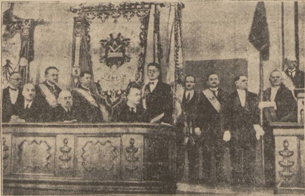
Die Eröffnung der Reichshandwerkswoche.

Neben diese Aufgaben tritt die soziale Mission des Handwerks, die in dem Zeitalter der Maschine mehr denn je eine ganz besondere Bedeutung hat.