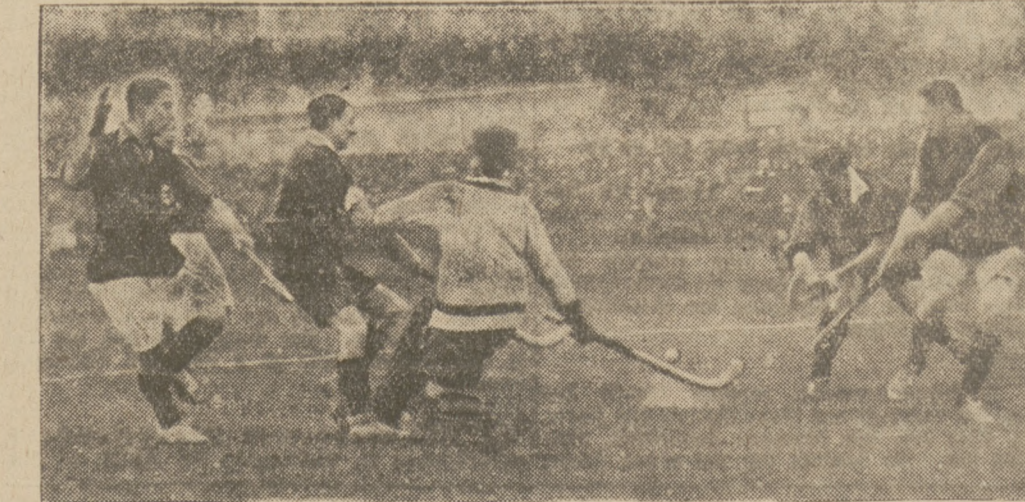
Vom Hokeny-Länderkampf Deutschland-Holland. Die deutschen Stürmer Müller (links) und Weiß im Schlusstreich der Holländer. Die deutsche Auswahlmannschaft, die am Sonntag in Leipzig gegen Hollands Hokeny-Gif antrat, mußte sich mit einem Unentschieden (2:2) begnügen.