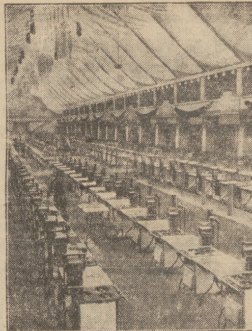
Von der Reichsgastwirtschaftsmesse in Berlin.