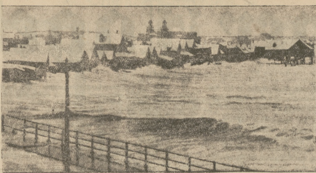
Sturmflut dringt in einen Badeort.

An der Küste von Massachusetts (U.S.A.) wütete eine gewaltige Sturmflut, welche die Wassermassen in die Villenkolonie von Revere Beach trieb.