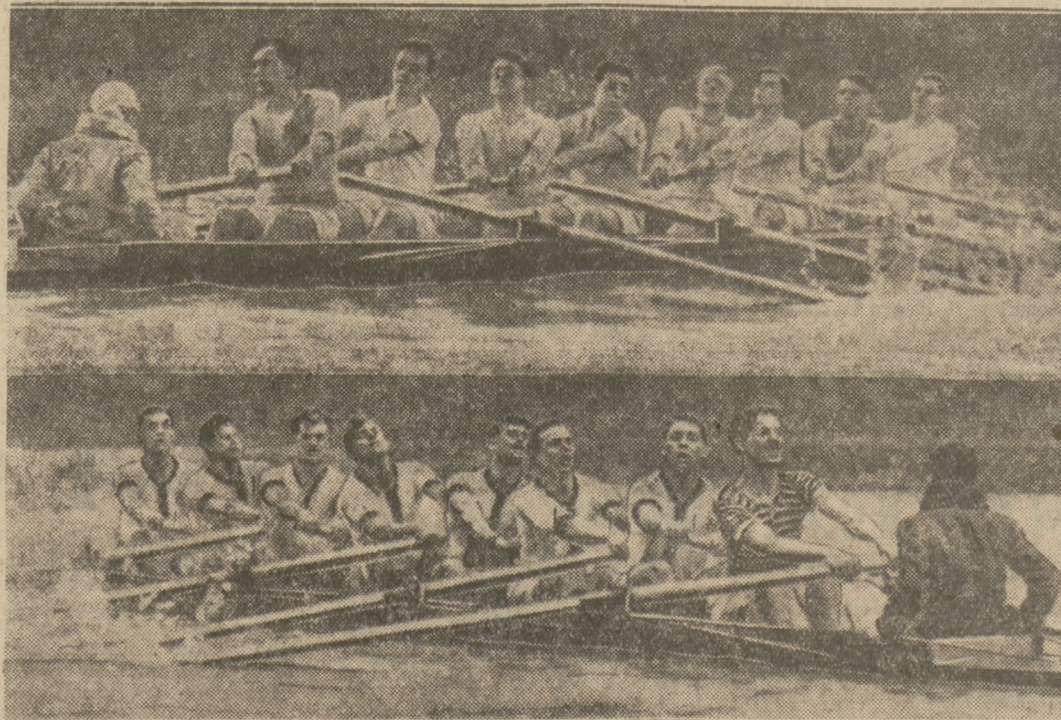
Zum hiesigen Ruderkampf Oxford—Cambridge.

Oxford erwischte das schlechtere Los und die schlechtere Seite. Nach dem Start lagen die Boote Bord an Bord, obwohl Oxford mit größerer Schlagzahl ruderte. Nach 1200 Meter ging Cambridge einen Meter vor, verlor die Führung aber fast wieder, ohne daß die Dunkelblauen je an ihrem Gegner hätten vorbeikommen können. Nach drei Kilometer gingen die Cambridgeer unwiderstehlich vor, und obwohl Oxford heroisch kämpfte und gelegentlich etwas aufholte, belohnte in den letzten, verzweifeltsten Endspurt, siegen die Hellblauen doch wiederum sehr sicher. Sie waren noch 19 Minuten 27 Sekunden mit 2½ Bootslängen vor Oxford im Ziele bei Mortlake.