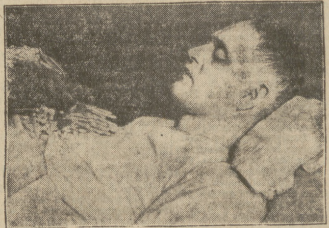
Hermann Müller auf dem Totenbett.

Seine politische Erfahrung befähigte ihn, in den schwersten Augenblicken deutscher Geschichte an führender Stelle zu stehen und den unantastbaren Aufgaben gerecht zu werden, die das Gesicht auf seine Schultern gelegt hatte. Als Außenminister im Jahr 1919 in den schmerzhaftesten Zeiten der Nachkriegsepoke und als Reichskanzler im Frühjahr 1920 bei den tragischen deutschen Zerwürfissen hat er sein Bestes hingegeben. In unser aller Erinnerung steht seine letzte Periode als deutscher Reichskanzler in den Jahren 1929/30. Unvergesslich ist uns allen die Vertretung unseres Reiches in Genf, wo er ritterlich und entschlossen die Verantwortung übernahm, für den damals schon schwer erkrankten Außenminister einzutreten.