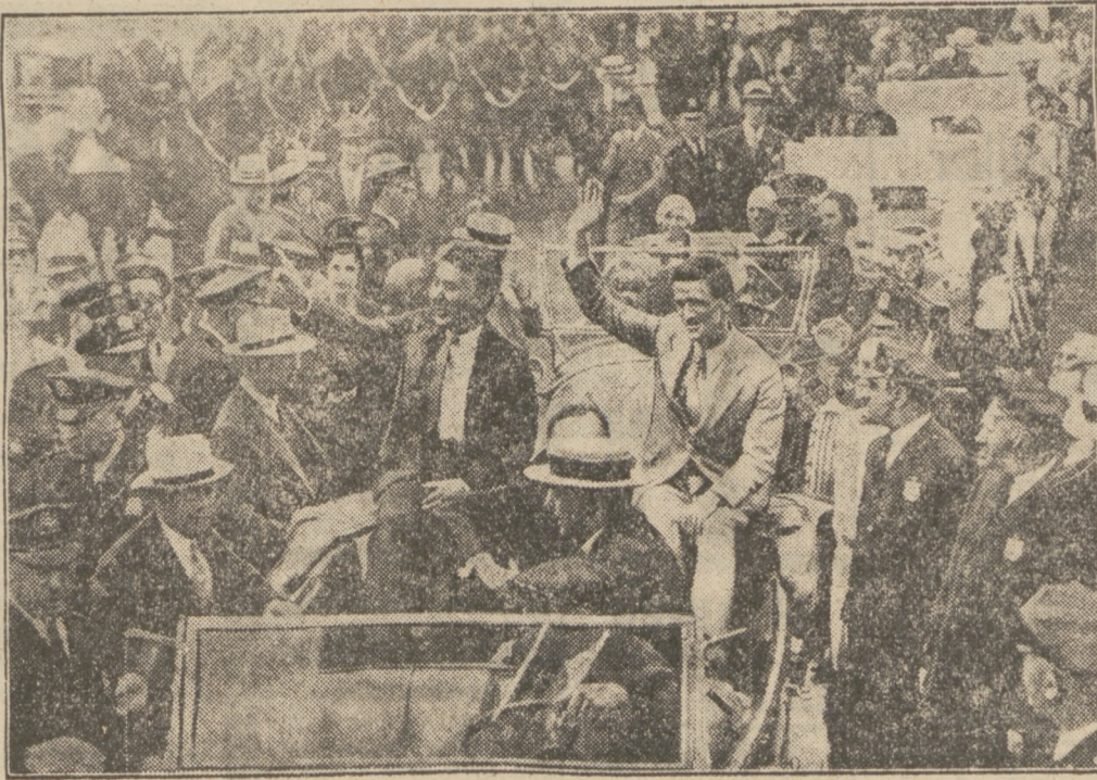
Der Empfang der Weltflieger in New York

Wie das „ABC“ meldet, ist in Sanierungsreisen das Gerücht verbreitet, daß der Ernennung des Lemberger Wojewoden die Veröffentlichung einer Regierungserklärung in der ukrainischen Frage und über Disziplinierung vorausgehen werde. In dieser Erklärung soll betont werden, daß jegliche Verständigung mit den ukrainischen