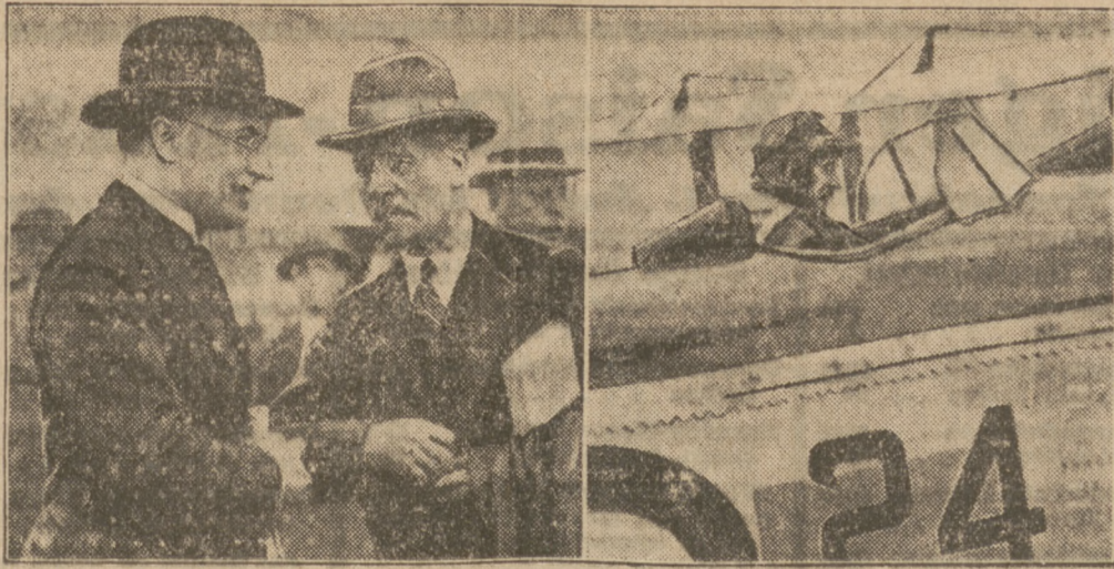
Macdonalds Abschied von Berlin. Der „fliegende Ministerpräsident“ verabschiedet sich von Reichkanzler Dr. Brüning auf dem Flugplatz Tempelhofer Feld.

Der „Nasz Przegląd“ spielt hierbei auf eine Aeußerung an, die gestern in der „Gazeta Polska“ getan wurde. Die „Gazeta Polska“ polemisierte in einem Artikel unter der Ueberschrift: Das deutsch-polnische Verhältnis — mit Aeußerungen der „Gazeta Warszawska“ und kam zu dem Schluß, daß Polen sich zwar in keinem Falle mit einer Revision seiner Grenzen einverstanden erklären würde, daß es aber trotzdem zu einer Verständigung mit Deutschland bereit sei und eine günstige Entwicklung und innere Befriedigung Deutschlands wünsche.