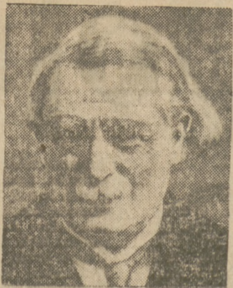
Lloyd George schwer erkrankt

gegangen in den letzten Wochen und ging und geht um Kopf und Kragen Europas. Von der Hitze der weltpolitischen Vorgänge haben auch wir im Inlande etwas abgekostet, das Fieberthermometer des Dollarkurses hat auch geschwankt. Der Dollar scheint sich jetzt auf einige Zeit stabilisieren zu wollen, und wenn er auf seinem jetzigen Stand bleibt, so ist immerhin eine Verschlechterung um 16 Punkte gegenüber seinem Stand vor einigen Wochen das Endergebnis der letzten Finanzstürme über Europa. Die Westpolitik scheint sich ein wenig zu beruhigen, die polnische Inlandspresse wird in diesen Tagen nur noch durch die Verhandlungen über die Zollunion im Haag bewegt. Sie kommentiert diese Verhandlungen zumeist in der ihr eigenen deutschfeindlichen Form. All diesen Worten des Hasses auf Deutschland und seine „gefräßigen“ Absichten seien aber folgende Worte an Deutschland des großen polnischen Führers der polnischen Emigration im vorigen Jahrhundert, Joachim Lelewel, entgegengesetzt: „Zur Erlangung gemeinsamen Glückes und Wohlergehens eurer Nation, zur Befestigung ihrer Freiheit und Unabhängigkeit, zum Sprengen des inneren und äußeren Joches der Bedrückung bleibt euch nur ein Weg: die politische Einigung Deutschlands, welche durch Vereinigung aller Bruderkämme der großen Nation in einem Körper verwirklicht werden soll.“