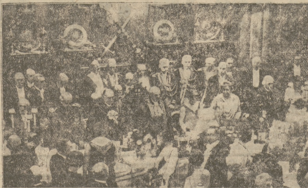
Das Festbankett zu Ehren des neuen Lordmayors von London

Das traditionelle Guildhall-Bankett; in der Mitte (vor dem Präsidentenstuhl) der neue Lordmayor Sir Maurice Jenkins.