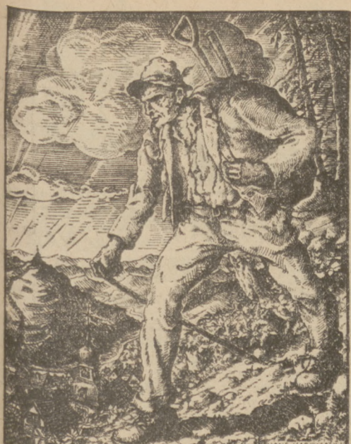
Heimwärts Nach einer Zeichnung von Hans Hartmann

In seinem Leitartikel „Schlüssel zum Balkan“ schreibt der „Dziennik Poznański“: „Und wieder eine Sensation, mit der sich die ganze Welt noch lange Wochen beschäftigen wird. Der Abschluß der Zollunion zwischen Deutschland und Österreich gehört nicht zu den politischen Schachzügen, über die man schnell zur Tagesordnung übergeht. Das ist etwas, was tief in das Leben der Völker hineinschneidet und an den Grundlagen der Verträge von Ver-