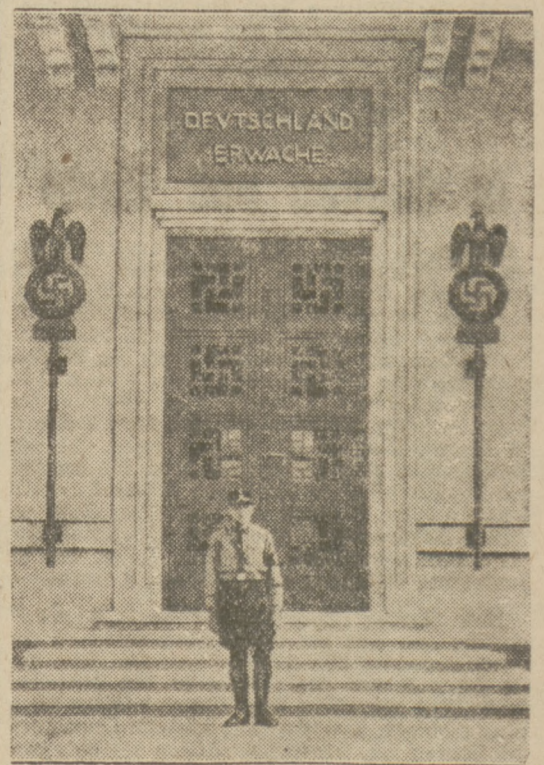
Das Hauptquartier der nationalsozialistischen Bewegung