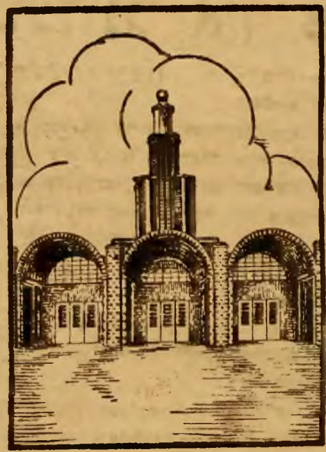
פארטיליאן סון די אינטער- גאנצענלע יארדיים אויף דער פויווער אויסשטע- לונג.

פארטיליאן, פוילישען-אויסלאנד' העט נאכן פערענדיגען די אויסשטע- לונג פערהאנדעלט הערען אויף א שטענדיגען מוועאום פאר דער פוילי- שער עמיגרציע.