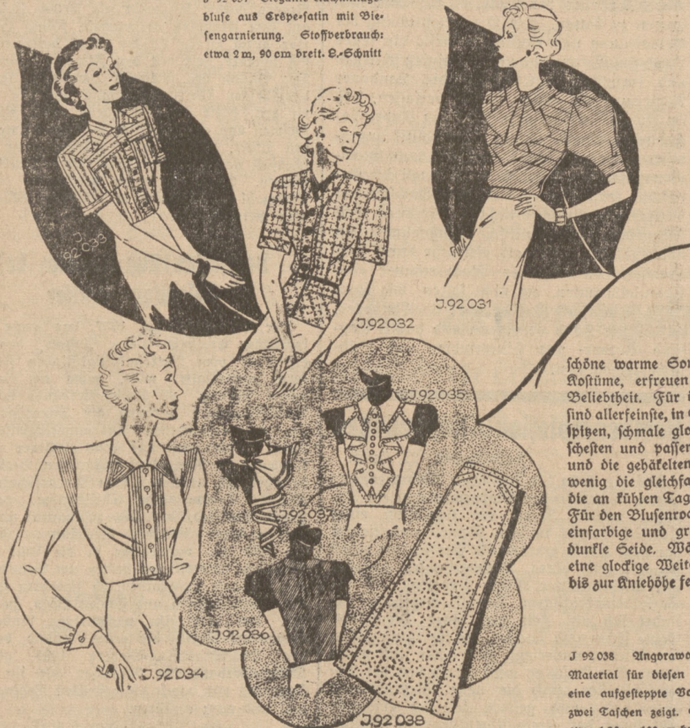
J 92 031 Elegante Nachmittagsbluse aus Crêpe-satin mit Vliesengarnierung. Stoffverbrauch: etwa 2 m, 90 cm breit. S-Schnitt

Das Rohrgeflecht bei Stühlen wird wieder straff und fest, wenn man den Stuhl stürzt, das Rohrgeflecht mit ganz heißem Wasser mittels eines Schwammes recht gründlich ansucht und abwäscht, so daß es sich tüchtig mit Wasser anfüllen kann. Hierauf stellt man den Stuhl in die freie Luft, noch besser in die scharfe Zugluft und läßt ihn trocknen. Der Erfolg wird jeden zufriedenstellen.