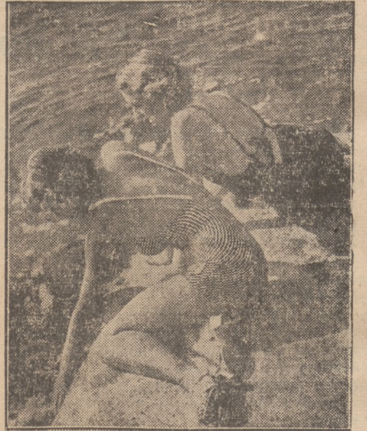
Bademoden wie man sie im Sommer 1937 überall am Strande sehen kann.

Mit dem Nizam von Hyderabad, dem reichsten Manne der Welt, trafen, unverschleiert, seine beiden Schwiegertöchter ein, beides Türkinnen, Tochter und Nichte des ehemaligen Kalifen. Sie verheirateten sich im Jahre 1931 in Nizza mit den beiden Söhnen des Nizams von Hyderabad. Diese beiden Frauen haben jahrelang mit großem Eifer für die Befreiung der indischen Frauen von dem Zwang der Tradition gearbeitet, und sie verkörpern in ihrer Person das moderne Indien. Sie werden aber erleben, daß die neue Zeit in Indien nicht so leicht Eingang finden und daß es noch viele Jahre dauern wird, bis der Schleier aus dem Leben der Inderin verschwindet. Er ist eben doch eine Zutat, die zwar gewisse Nachteile, aber auch unbedingte Vorzüge hat.