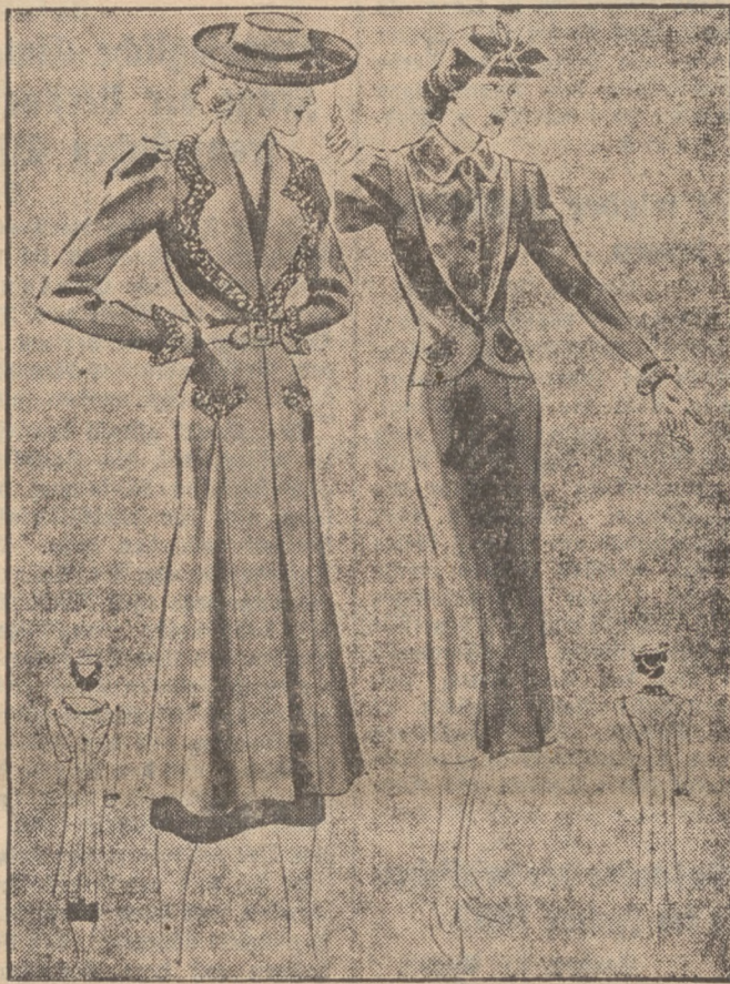
Schrittmacher der Herbstmode

Das Einkind kann natürlich auch ein sehr tüchtiger, vergnügter und tapferer Mensch werden. Aber es gibt doch eine auffallend große Zahl von Einkindern, die es zum mindesten viel, viel schwerer im Leben haben als Kinder, die unter Geschwistern schon früh Gemeinschaftsgefühl und praktisches Leben kennen lernten. Das Einkind muß im Leben oft viel mehr „nachlernen“, hat viele Folgen falscher Erziehung und Verwöhnung zu überwinden, kann sich häufiger viel schwerer durchsetzen.