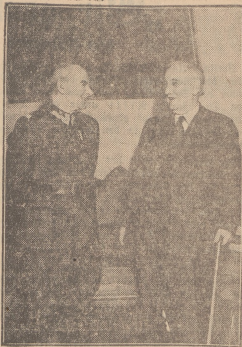
George Lansbury in Warschau

New York. Als Vorsitzender des panamerikanischen technischen Komitees hat Oberst Lindbergh eine Ausschreibung für 24 Transozeanflugzeuge veröffentlicht. Jedes Flugzeug muß hundert Passagiere und eine Frachtladung aufnehmen können; es muß im Non-Stop-Flug 8000 Kilometer mit einer Durchschnittsgeschwindigkeit von 320 Stundenkilometer zurücklegen und schließlich 8000 Meter hoch aufsteigen können.