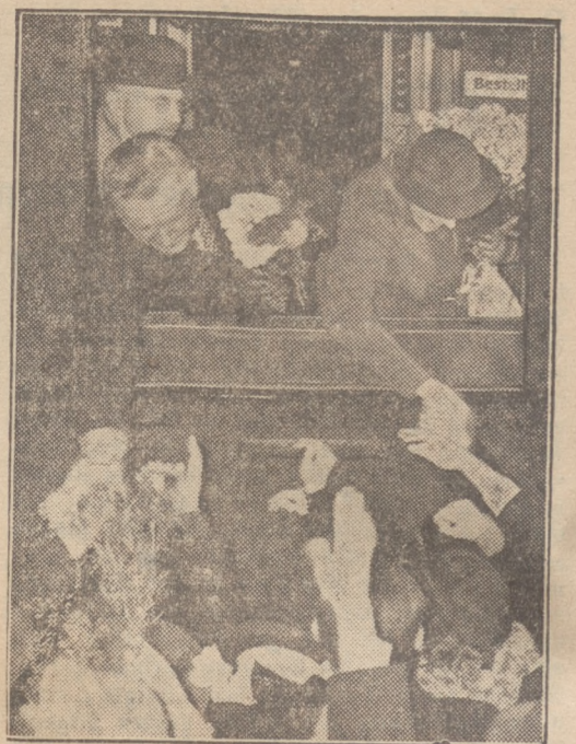
Asienforscher Dr. Filchner in Berlin

Die Berliner Mannschaft „Rot-Weiß“, die am Eishockey-Turnier in Rynica teilnahm und in ihrem Schlupfpiel gegen Jaworzyna vom Platz ging, als ein Tor nicht anerkannt wurde, ist von der Eishockeyführung des zuständigen Gaus vom Spielbetrieb gesperrt worden. Diese Maßnahme bezweckt eine Klärung des unklaren Vorfalls.