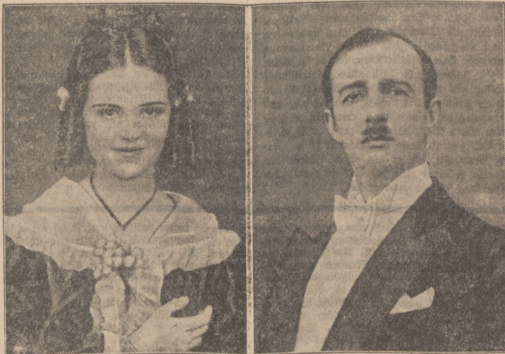
Verlobung des Königs von Albanien

Warschau, 1. Februar. (Eigener Drahtbericht.) Am Mittwoch wird im Büro des DZM die feierliche Eröffnung des „Jugenddienstes“ des DZM stattfinden. Der Eröffnung sind langwierige Verhandlungen Major Galinats mit den verschiedenen Jugendverbänden vorausgegangen. Dabei ergaben sich die größten Schwierigkeiten. Nicht nur, daß die zur Teilnahme eingelaufenen oppositionellen Verbände, wie die Wice, absagten, sondern auch die zur Grazniski-Gruppe gehörenden Verbände machten Vorbehalte. Der ursprüngliche Name „Front der Jugend“ wurde unter diesen Umständen aufgehoben und der Name „Jugenddienst“ gewählt.