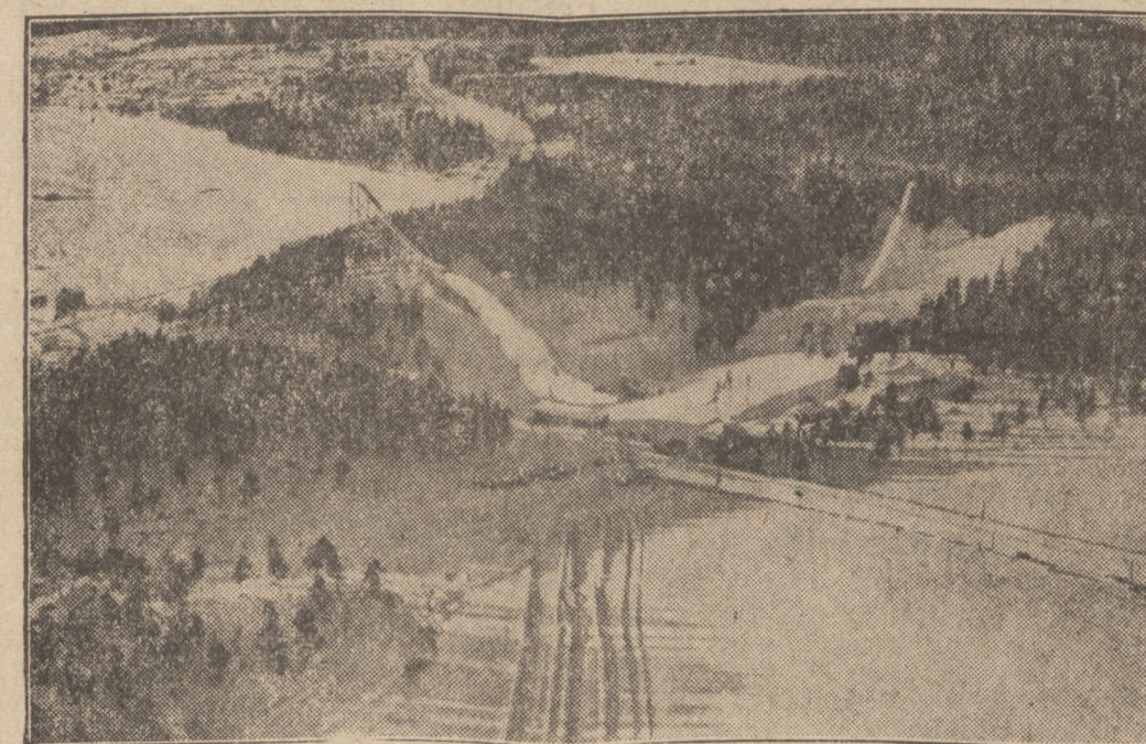
Hier beginnen heute die Stiweltmeisterschaften

Die Aufmerksamkeit wendet sich damit mehr und mehr dem Baustoff des Autos, dem „Material“, zu. Zwei Forderungen sind hier zu erfüllen: man braucht immer bessere Werkstoffe und man muß die Beanspruchungen, die im praktischen Betrieb an sie gestellt werden, immer genauer kennen und berechnen lernen. Den ungeheuren Segen der vervollkommenen Werkstoffe kann man leicht am Beispiel des Eisens, das bei einem Auto 85 Prozent vom Gewicht ausmacht, verfolgen. Vom Gußeisen, das zwar hart und druckfest, aber spröde ist, führte der Weg zum zäheren Schmiede-Eisen, zum Stahl. Schon der Unterschied zwischen einer alten gußeisernen Brücke und einer modernen Stahlbrücke läßt die gewaltigen Möglichkeiten der Materialersparnis durch diese Werkstoffverbesserung erkennen.