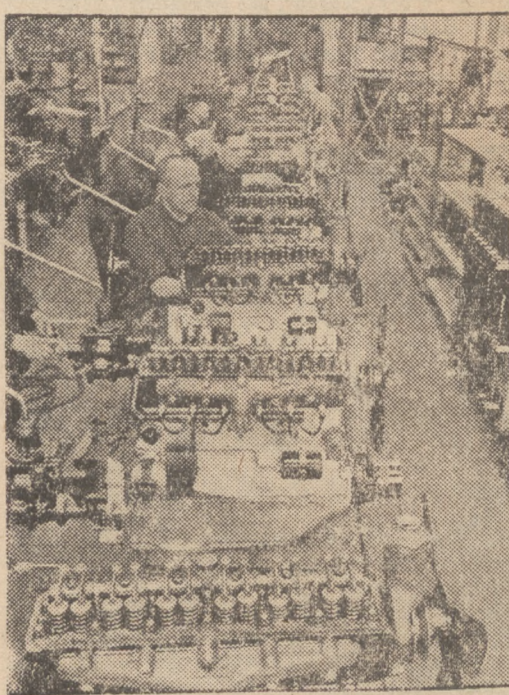
Das Herz des Wagens! Motor um Motor wird peinlich genau montiert.

Wenn der Besucher dieses Jahr durch die große und schöne Schau der Wagen und Motorräder am Kaiserdamm zu Berlin wandert, stellt er fast noch deutlicher als im Vorjahr fest, daß die technische Entwicklung des Kraftfahrzeuges an einer Grenze angelangt ist, deren Ueber-schreitung kaum noch wahrscheinlich ist. Alle die verschiedenen Fortschritte, die in den letzten Jahren fast stürmisch aufeinander folgten, die verschiedenen Federungsarten, Frontantrieb, Zweifaktter, Schwingachse usw., sind zu einem