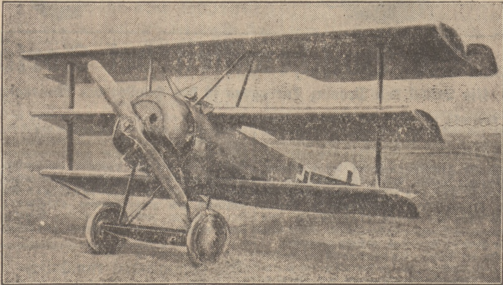
Das war Richthofens Flugzeug