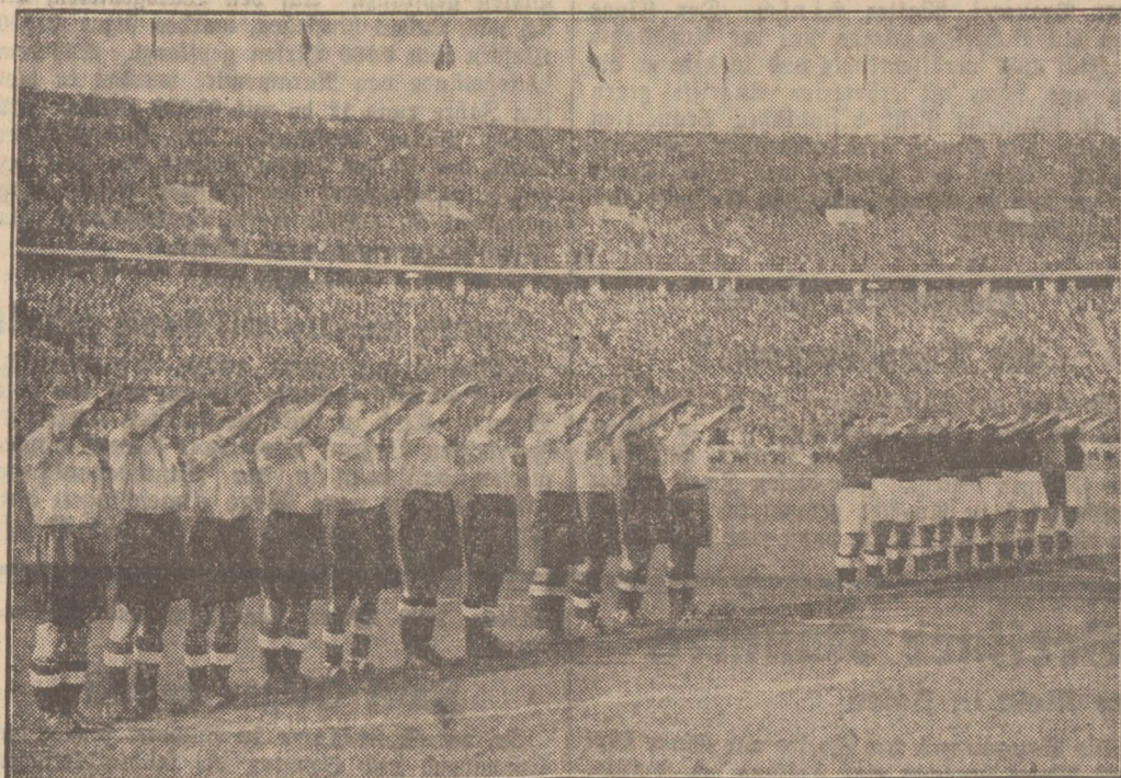
Das größte fußballportliche Ereignis des Jahres Ein Bild in das bis auf den letzten Platz gefüllte Olympiastadion in Berlin vor Beginn des Kampfes. Die beiden Mannschaften während der Nationalhymnen. Links die später verbitterte siegreiche englische Profi-Elf, rechts die deutsche Mannschaft

S Wohnhausbrand. Sonntag nachmittag gegen 3.30 Uhr wurde die hiesige Freiwillige Feuerwehr zu einem Brande bei Dwisinski in Stefanowo alarmiert, wo ein Einwohnerhaus aus Fachwerk, das von vier Familien be-