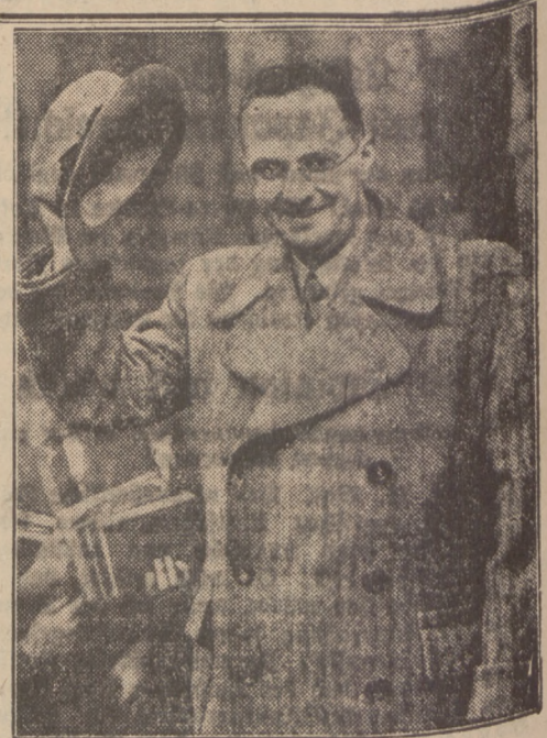
Konrad Henlein in London

Wien, 16. Mai. Die Arbeitsgemeinschaft für den religiösen Frieden hat unter der Geistlichkeit der deutschen Ostmark Unterschriften für eine Adresse an die österreichischen Bischöfe gesammelt, die Zustimmung und Dank für die Stellungnahme des Episkopats zur Wiedervereinigung Österreichs mit dem Reich zum neuen Staat und zur Abstimmung vom 10. April ausdrückt. Der Erfolg der Unterschriftenaktion, die bis zum 25. August läuft, hat schon bisher alle Erwartungen übertroffen. Besonders stark beteiligt hatten sich vor allem Pfarrer, Kaplanen, Katecheten. Auch viele Hochschulprofessoren befinden sich unter den Unterzeichnern.