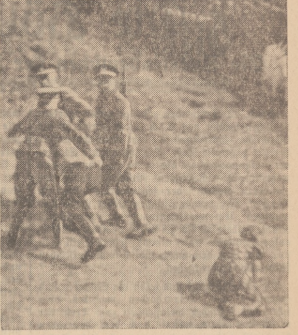
Bild links: Musterung für das Subetendeutsche Freikorps. Unmittelbar nach der Bekanntgabe der Errichtung des Subetendeutschen Freikorps durch Konrad Henlein führten die subetendeutschen Männer zu den Sammelplätzen und meldeten sich zum Kampf für die Freiheit ihrer Heimat. Unser Bild zeigt einen Augenblick der Musterung. — Bild Mitte: Auch die slowakischen Soldaten flüchten nach Deutschland. Zahlreiche slowakische Soldaten haben in den letzten Tagen die deutsche Reichsgrenze überschritten, weil sie den Tschechenterror nicht mitmachen wollten. Unser Bild zeigt slowakische Soldaten in der Uniform des tschechischen Heeres nach ihrem Grenzübertritt in Freiburg in Sachsen. — Bild rechts: Mit Gewalt zum Militärdienst geschleppt. Ein erschreckendes Bildokument, das die Methoden veranschaulicht, mit denen die Subetendeutschen von den Tschechen zum Militärdienst gepreßt werden. Nachdem die Frau brutal niedergeschlagen worden war, schleppte man ihren Mann mit Gewalt fort.