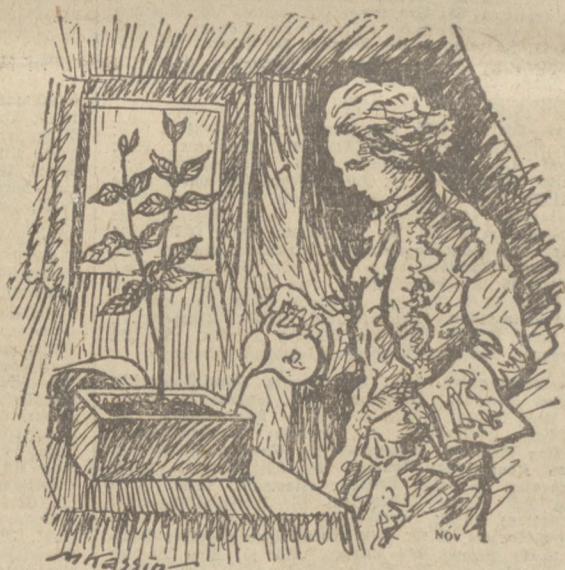
Dem Bäumchen gab er schließlich mehr Wasser, als er selber zum Trinken behielt.