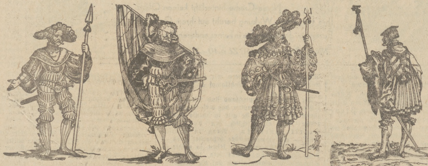
In der Landsknechtszeit entstanden die meisten Rangbezeichnungen Feldwebel Fähnrich Feldhauptmann Leutnant