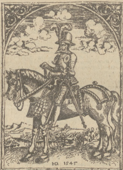
Das alte Bild aus dem Jahre 1545 verrät in seiner Unterschrift noch die Herkunft des Wortes „Feldmarschall“.

Aber Leutnant ist nicht so leicht zu erkennen. Noch vor einem Menschenalter schrieb und sprach man dafür „Lieutenant“, wiederum ein französisches Wort, das soviel wie „Statthalter“ bedeutet. Der Leutnant ist also der Statthalter oder Stellvertreter des Hauptmanns. Der Franzosenkönig Ludwig XIV. hat mit der Schaffung des ersten stehenden Heeres in Europa auch die anderen Völker zur Aufrüstung angeregt. Das war 1665. Und aus dieser Zeit stammen denn auch die meisten französischen Rangbezeichnungen, die man dem französischen Vorbild entlehnte. Major heißt einfach „höherer Offizier“ und General ist der die Allgemeinheit befehlende Offizier. Der Oberst und der Feldmarschall sind nun wieder rein deutschen Ursprungs: der Oberst ist eben der oberste seines Regiments und der Feld-Marschall ist eigentlich (denn man heißt Mähre oder Pferd, und schall ist Knecht) der Feld-Pferdeknecht, der oberste Stallmeister seines Herrn.